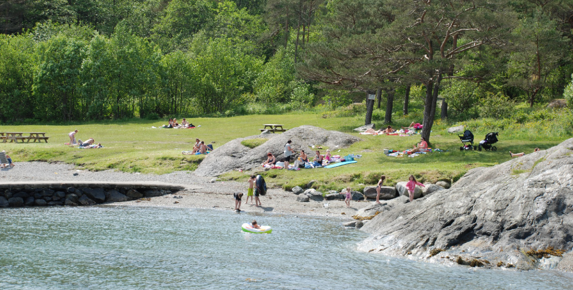
Sponavik badestrand / Sponavik beach