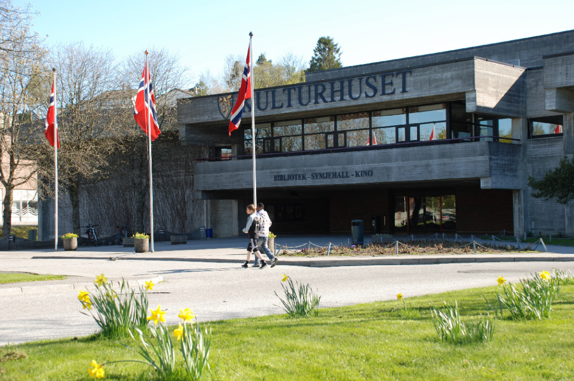
Stord kulturhus / Stord Cultural Centre