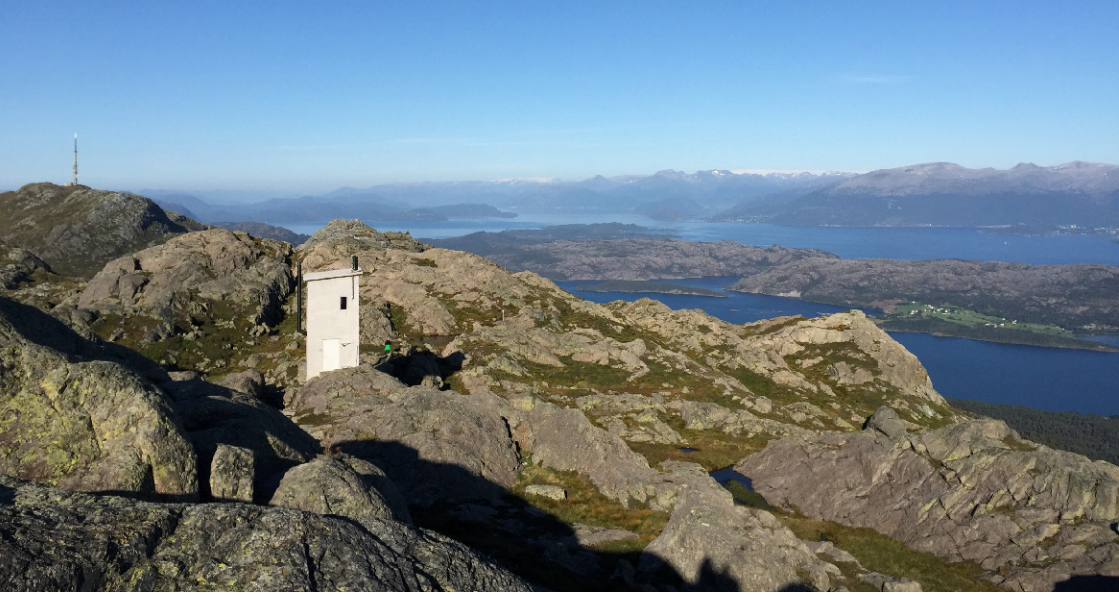
Frå Stovegulvet / Stord mountains