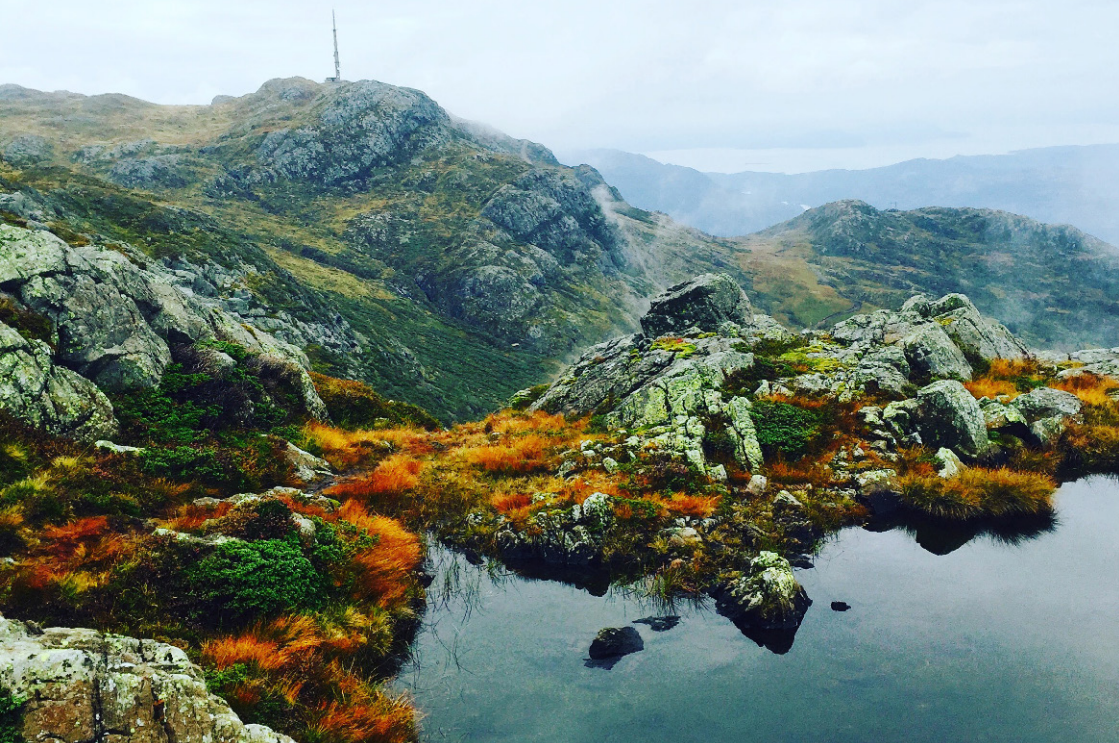
Fjellet Kattnakken / Mountain Kattnakken