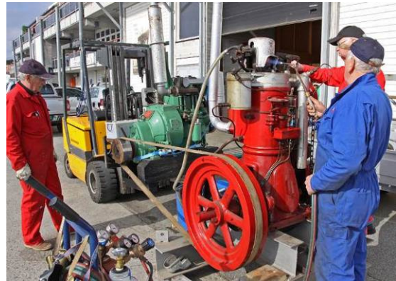
Stord Maritime museum