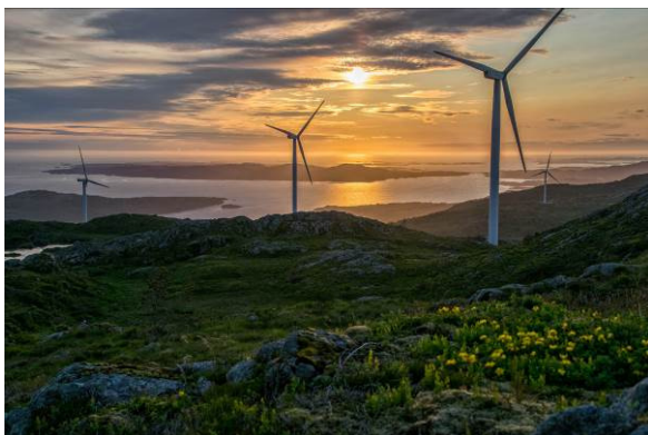
Frå Vindmølleparken i Fitjar

Ser me til folkehelselova vil det vera viktig å nå ut til folk med stor breidde i høve tilbod om fysisk aktivitet. Det må difor vera ei utfordring for regionen og kvar einskild kommune å utvikla regionale anlegg som gjev ei betre breidde i tilbodet totalt sett.