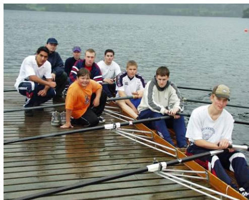
Kvinnherad Rosenter

Kvinnherad rosenter vart etablert i 1991 og held til i Opsangervatnet, Husnes. Anlegget vert drifta av Kvinnherad roklubb og er etablert i tråd med Roforbundet sine retningslinjer og ønsker. Anlegget består av 500 meter bane, 2000 meter bane og rohuse. Rohuset inneheld møterom, samlingslokale, kjøkken, lager, treningsstudio og garderobar. Det er 2 brygger som gir tilgang til vatnet og følgebåt med motor.