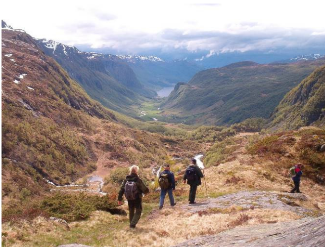
Stordalen frå Bjødnanut

Etnefjella strekker seg om lag 5 mil frå Ølen i vest til Seljestad i aust. Der går T-merka løyper gjennom heile området og har seks turisthytter i regi av Haugesund Turistforening. Frå Etnesida er der rundt ti oppgangspunkt til fjellet, spreitt jamt ut frå Etne i vest, via Stordalen og austover langs E-134 i Åkrafjorden.