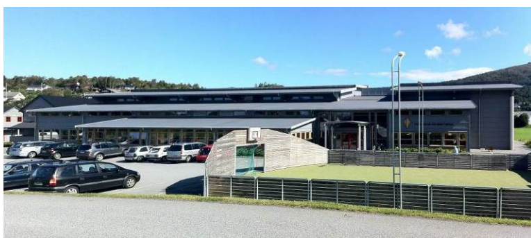
Fitjar kultur og idrettsbygg

Fitjar kultur og idrettsbygg har avtale med Norsk bygdekino. Kinoen har godt besøk og er 6. mest besøkte bygdekinoen i landet.