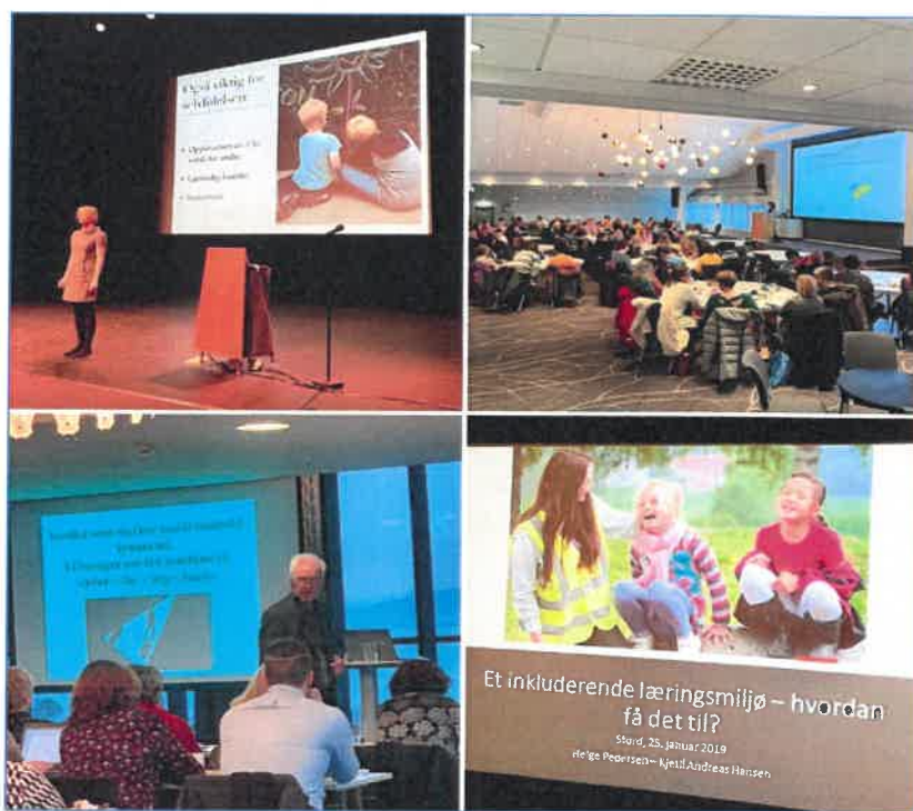
Regional fagdag den 25.01.19