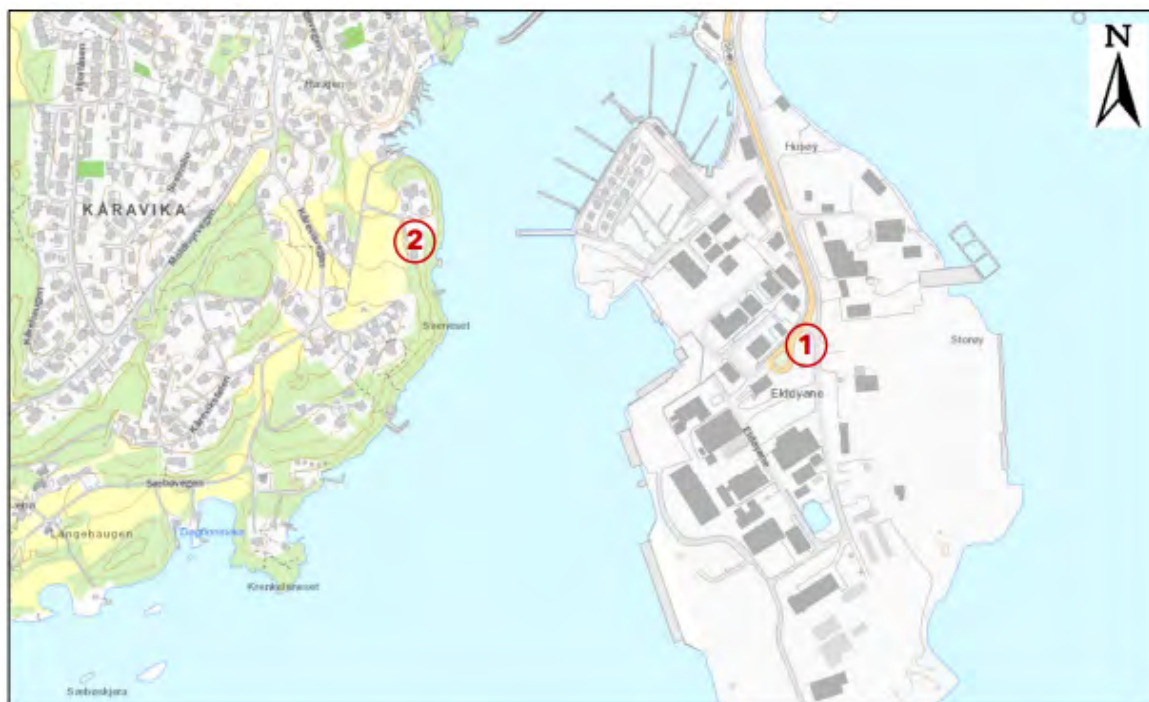
Figur 1-1: Plasseringene av målestasjonene er markert med rød sirkel og nummerert 1-2. Kartet er hentet fra Asplan Viak AS sin kartløsning Adaptive.

Det er no plassert støymålarar som måler støy, viser kva retning den dominerande støyen kjem frå, og gjer opptak av lydbildet. Det er også sett opp ein vêrmålar som dataene vert vurdert mot. Stord hamn har avtale med Asplan Viak AS for levering av tenesta og utarbeiding av månadlege rapportar på støybildet. Støymålarane er plasserte slik figuren under viser: